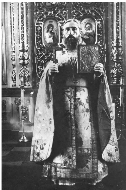
Священномученик Александр Аксенов.

Собственно говоря, вся история человечества и истории конкретных людей и состоят в том, были ли они с Богом или отвернулись от Него. Наш народ через тяжелые испытания вынес истину — с Богом хоть за море, а без Бога ни до порога. Пусть же подвиг новомучеников и исповедников Церкви Русской будет свято и бережно храним нашей исторической памятью, а их молитвенное предстательство укрепляет наш народ в вере».