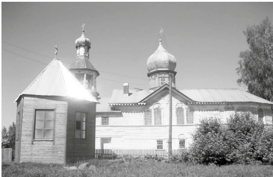
Никольский храм с. Алешево в наши дни.