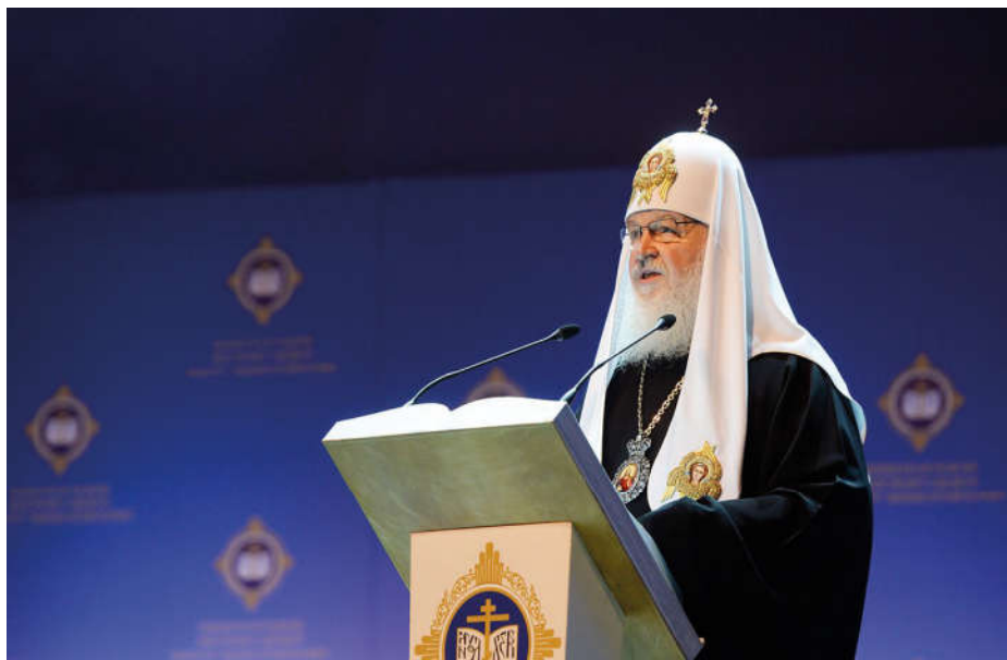
Святейший Патриарх Московский и всея Руси Кирилл.

В 90-е годы нас пугали тем, что нашей молодежи больше нет. Утверждали, что большинство людей талантливых, образованных уехали за границу, остались одни неудачники. От безысходности среди молодежи стало распространяться множество пороков. Депрессивной была вся общественная атмосфера, и молодежь находилась под ее воздействием. Иногда, указывая на молодежь, нам говорили: «И это ваше будущее? У вас нет будущего!»